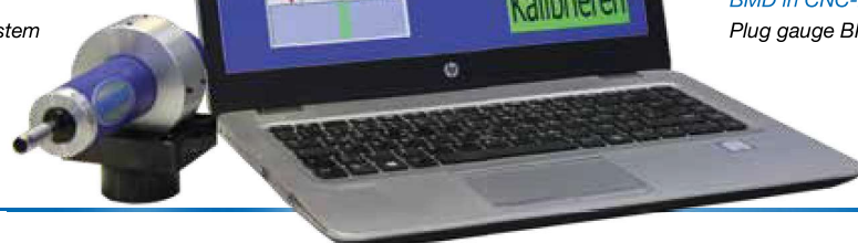
BMD in CNC-Drehmaschine Plug gauge BMD in CNC turning machine